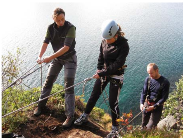
Base Camp på Skogsøya med Vesterålen friluftsråd som hovedansvarlig

Følgende strategier er vedtatt for å nå målene