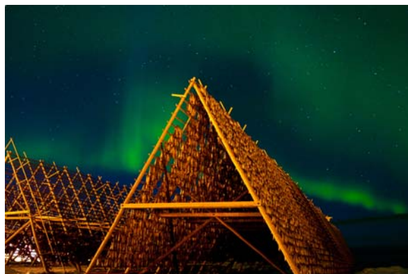
Katedral i nordlys

Det ble igangsatt arbeid med å gjennomgå aktuelle leverandører for flycharter og kvalitetssikring av tilbudene. Samtidig ble det laget planer for videre satsing med produktorganisering, visningsturer og messedeltakelse.