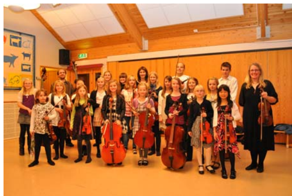
Vesterålen Juniororkester markerte 15 år i 2010