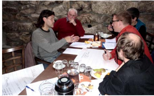
Revitaliseringsseminaret på Andøy Friluftssenter i oktober. Her gruppa i Øksnes.