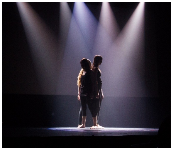
Danseinnslag med elever fra Sortland kulturskole. Filmfesten under Laterna Magica.