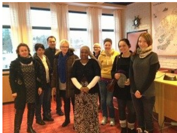
Fra motivasjonsløftet i Hadsel

(Kursportalen http://vesteralen.frikomport.no har fra leverandørens side ikke ennå ferdig utviklet statistikkeneheten slik at vi bare kan hente ut samlet antall deltakere og ikke deltakere fordelt på hver kommune. Dette vil være ferdig utviklet i løpet av 2013).