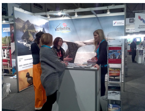
Fra Telenor Arena

Virksomheten viser økt omsetning med et stabilt medlemstall. Regnskapet viser at næringslivet slutter opp om aktivitetene og at kommunenes bidrag er vesentlig. Vesterålen reiseliv spiller i dag en viktig rolle som utviklingsaktør på web/online booking og er en av de mest aktive samarbeidspartnerne for Nordnorsk reiseliv. Dette illustreres gjennom det store antallet visningsturer som er gjennomført i 2012 og kampanjene Vesterålen reiseliv deltar i. Gjennom deltakelse i Arena Innovative vinteropplevelser har Vesterålen tatt en førende rolle i arbeidet med distribusjon av produkter på det tyske markedet. Gjennom tilskudd fra Vesterålen utvikling har Vesterålen reiseliv kunnet gi næringslivet en rimelig deltakelse på en rekke aktiviteter.