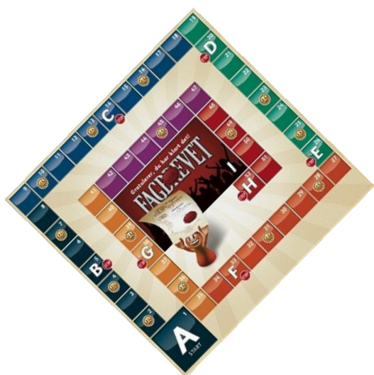
Brettspillet Veien til fagbrevet

For å ytterligere spre informasjon om hvordan voksne kan ta fagbrev, har RKK utviklet et spill til nytte og glede både for ledere, ufaglærte og politikere.