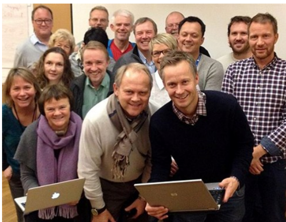
Fra første samling i Ny læringsarena høsten 2013 Hurtigrutens Hus, Stokmarknes

I 2013 ble arbeidet med kompetanseutvikling ytterligere intensivert i forbindelse med at RKK fikk nye samarbeidsparter: Fire regioner i Telemark og KS/KommIT. RKK har i tillegg vært pådriver for at kommunene i 2013 gikk til anskaffelse av utstyr for å kunne ta i mot nettbaserte kurs.