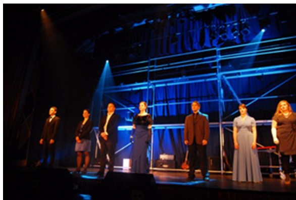
Fra forestillingen MOTSTRØMS med unge kulturarbeidere i Vesterålen.