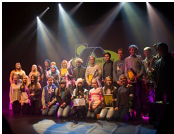
Vinnere i filmkonkurransen Laterna Magica, samlet på scenen under filmfesten