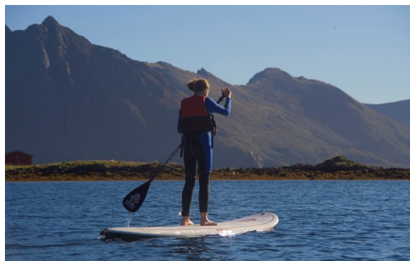
Basecamp 2013

I 2013 markerte vi også at det er 30 år siden Kultursamarbeidet i Vesterålen ble etablert. Først som en forsøksordning, men erfaringene var så positive at ordningen ble fast etter 3 år. Gjennom 30 år med kultursamarbeid har kommunene i Vesterålen løst en rekke kulturoppgaver i fellesskap, som hver enkelt kommune er for liten til å løse alene. Mange ulike prosjekter har vært gjennomført, og flere faste ordninger ble etter hvert etablert under Kultursamarbeidet i Vesterålen. Da vi skulle markere 30 år, valgte vi å markere dette med kulturseminaret «Røtter, vinger og ny oppdrift» og forestillingen «MOTSTRØMS» med unge kulturarbeidere fra Vesterålen.