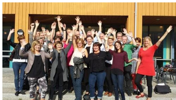
Samling i Nordlandsløftet, Campus Helgeland, Mo i Rana høsten 2013

I tillegg koordinerer RKK Regionalt forum av Nordlandsløftet hvor samtlige kompetanseaktører i regionen både for privat og offentlig virksomhet er invitert til å delta. På møtene denne gruppa har hatt i 2013 har følgende deltatt: UiN, KS, OPUS Hadsel, Opus Sortland, NAROM, Fagskolen, FU, Kunnskapsparken, Fabrikken Næringshage, Vesterålen Fiskeripark, Opplæringskontoret, Karrieresenter Vesterålen og RKK.