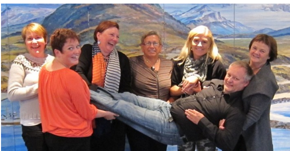
Fra 1. møte i Regionalt forum for Nordlandsløftet, Kråkberget, Bø september 2013.

RKK Vesterålen har i 2013 deltatt i utviklingen av samarbeidsforumet Nordlandsløftet som gjelder hele Nordland fylke, og har etablert og koordinerer Regional gruppe av Nordlandsløftet hvor alle kompetanseaktører i Vesterålen er invitert til å delta.