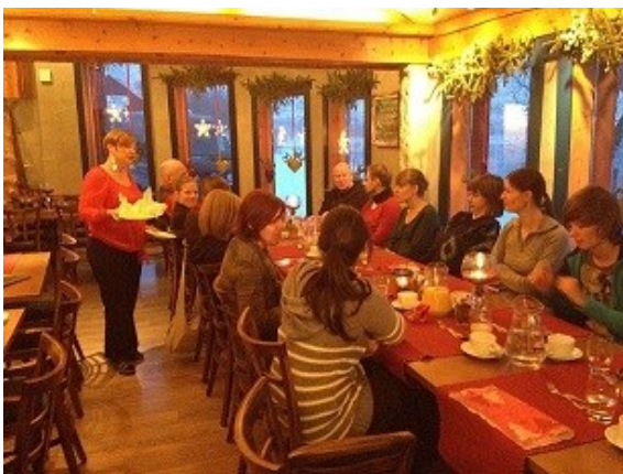
Fra visningstur med Nordic Info, Belgia. Her hos Andøy Friluftssenter

I forbindelse med Arctic Race of Norway hadde Vesterålen reiseliv ansvaret for oppfølging av media, blant annet i forbindelse med selve TV-produksjonen for TV-2/internasjonale TV-stasjoner.